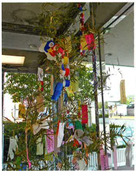
玄関前の七夕飾り