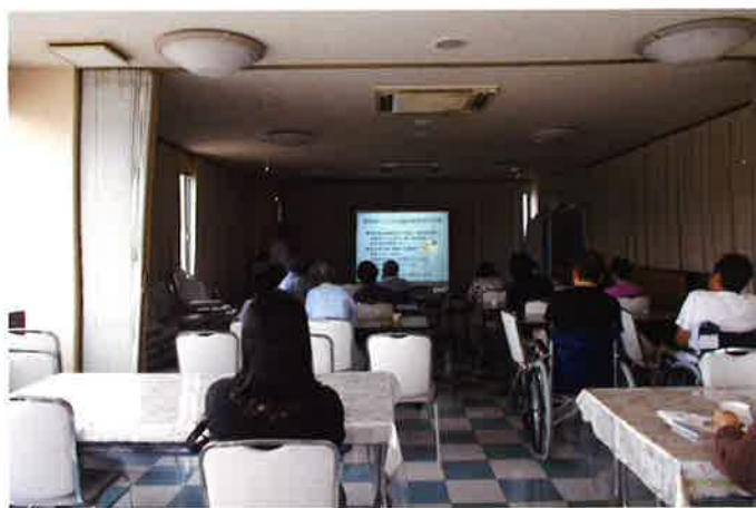
糖尿病教室の様子