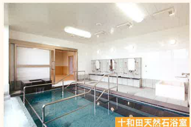
十和田天然石浴室